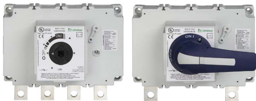
Interrupidores de desconexión de CC