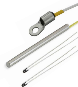
Sensores de temperatura