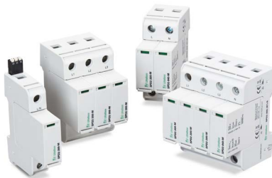
Dispositivos de protección contra sobretensiones