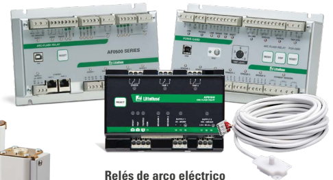
Relés de arco eléctrico