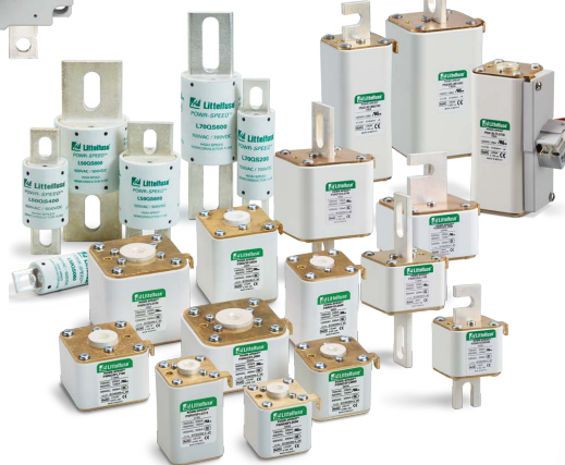
Fusibles semiconductores de alta velocidad